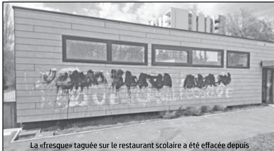
La «fresque» taguée sur le restaurant scolaire a été effacée depuis

Effraction, casse ou détérioration. La grotte est l'endroit le plus important pour la meute. ▪ Savoir trouver de quoi préparer un feu afin d'avoir un chouette foyer autour duquel se réchauffer et préparer ses futures chasses. Ici pas de cueilleurs, il n'y a que des chasseurs dans la meute. ▪ Utiliser de la peinture afin de marquer les lieux pour laisser des traces aux prochains groupes qui seraient tentés de venir squatter. Laisser son empreinte, comme à Lascaux pour les générations suivantes. Et effrayer les autres meutes. ▪ Apprendre la vie en meute. Savoir reconnaître le dominant, ne pas essayer d'aller contre ses décisions mêmes les plus ridicules ou les plus stupides. Quelles seront les prochaines activités ? Chasse d'animaux sauvages pour se sustenter, hérissons, écureuils, chiens errants ? La survie au sein des autres tribus qui utilisent des outils modernes avec apprentissage du camouflage pour échapper aux prédateurs qui les pourchassent et leurs caméras aux yeux acérés ? Gageons qu'au train où vont les choses, nous en saurons plus rapidement, à n'en pas douter !