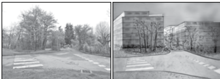
Carrefour de la crèche, piste cyclable côté piscine