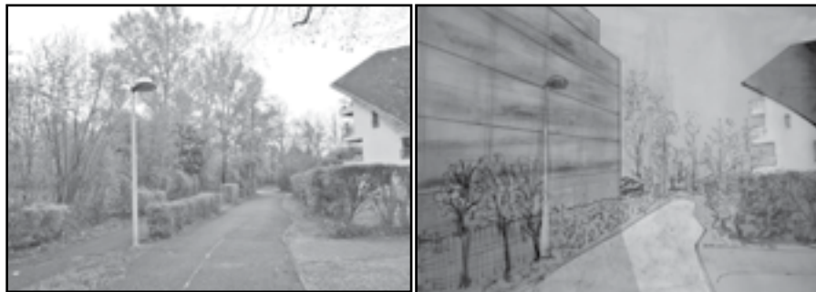
Piste cyclable avant le tunnel sous l'avenue du Vercors