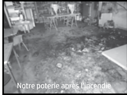
Notre poterie après l'incendie

Découvrons une nouvelle tendance ! Nous pensions une partie de notre jeunesse désœuvrée, alors même qu'elle inventait, qu'elle innovait en créant une nouvelle activité, « le préhistorisme » au sein même de notre commune. Des groupes organisés comme au temps de nos ancêtres afin de pratiquer des activités saines et enrichissantes. Attention avant de pratiquer il est nécessaire de considérer que nos ancêtres avaient de plus petits cerveaux que nous, il faut donc s'obliger à ne pas réfléchir et faire tout à l'instinct ! Ensemble ils découvrent comment chercher un refuge dans un milieu hostile (une ville emplie d'homo-sapiens) : ▪ Chercher un abri et y pénétrer en usant de toutes les tactiques possibles.